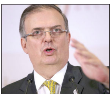
Marcelo Ebrard Casaubón.