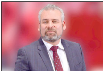
Alfredo Ramírez Bedolla.