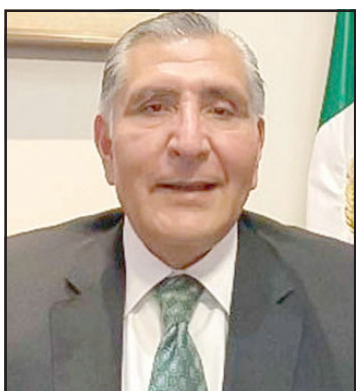
Adán Augusto López Hernández.