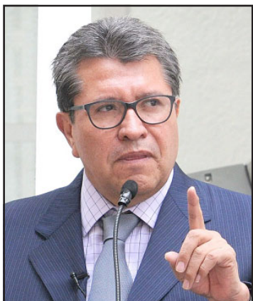
Ricardo Monreal Avila.