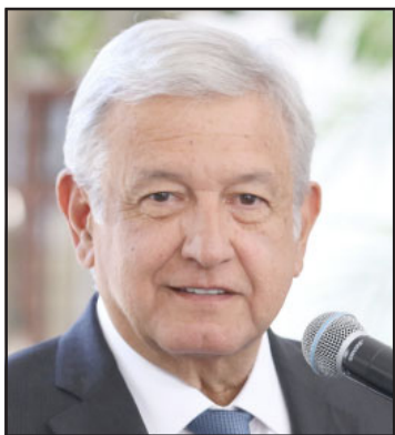
Andrés Manuel López Obrador.