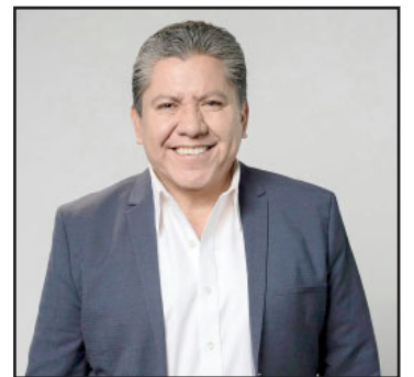
David Monreal Avila.

Veremos qué es lo que pasa. Tras dar a conocer su lectura del panorama y su posición en vísperas de que se llegue el momento, sí podemos asegurar que nadie tiene asegurado ese lugar máxime, cuando se trata de una figura de la talla de Monreal que lo he dicho una y otra vez, es un animal político que sabe jugar en cualquier cancha de visitante o de local.