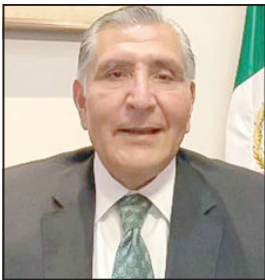
Adán Augusto López.

Era obvio que Marko Cortés sabía de la cumbre. Dadas las circunstancias, tuvo que simular. Fue lo mismo que hizo en el proceso interno del PAN: Los militantes denunciaron una proporción de la elección desigual; el CEN aprovechó los mecanismos y