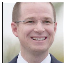
Ricardo Anaya Cortés.