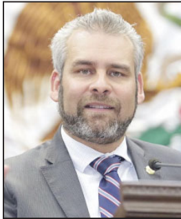
Alfredo Ramírez Bedolla.