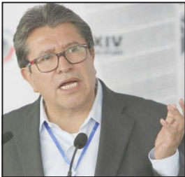
Ricardo Monreal Avila.